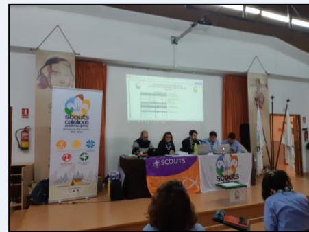
Asamblea Diocesana en la sede del G.S. Ntra. Sra. del Pilar (23 de febrero).