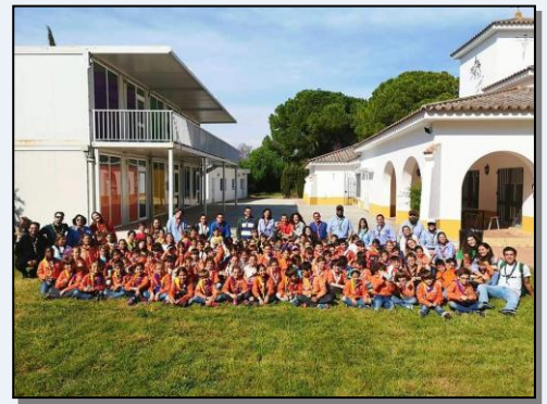
Chapoteo de Castores en la Casa Nazaret (23 de marzo).