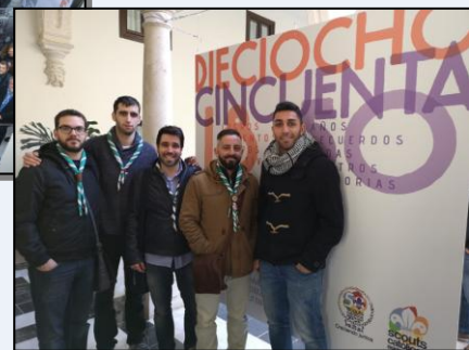
Inauguración de la Exposición del 50º Aniversario de la Delegación en el Obispado (2 de febrero).