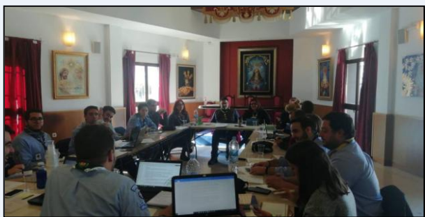
Consejo Diocesano en Jerez de la Fra. (2 de febrero).