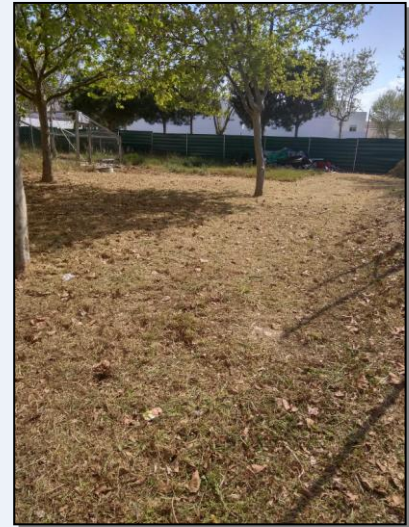
Limpieza de los alrededores de los locales con la colaboración de los padres.