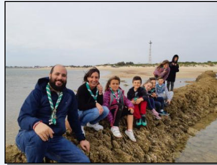
Visita de los Castores a los Corrales de Rota (30 de marzo).