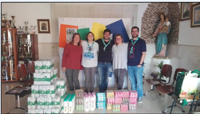
Colaboración con la V Carrera Solidaria de los Salesianos Cooperadores.