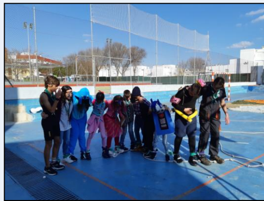
Reunión de carnavales.