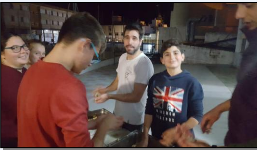
Taller de cocina con los Rangers.