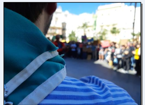
Concentración en Cádiz frente al cambio climático (15 de marzo).