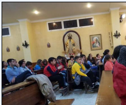
Eucaristía, Triduo de San Juan Bosco.