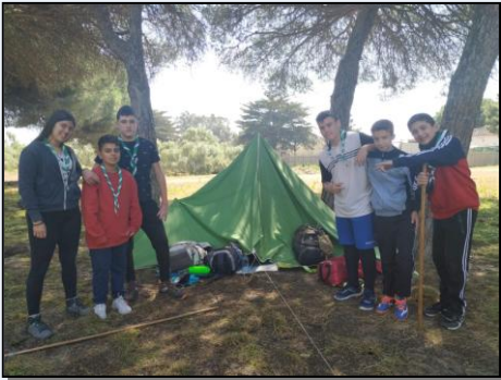
Acampada de Tropa Ranger en la finca Echavarri (22-24 de marzo).