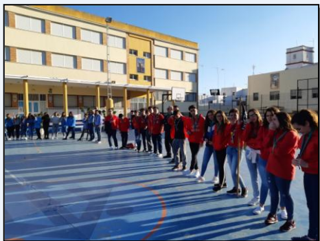
Ceremonia de Imposiciones en el Colegio Salesianos tras el Campamento de Navidad.