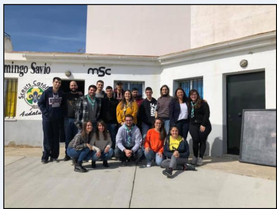
Taller de Necesidades Educativas Especiales con la colaboración de Gabinete Psicopedagógico "Capaces".