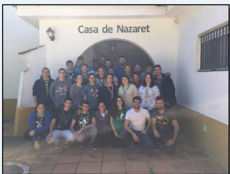
Final del curso MTL/RU.