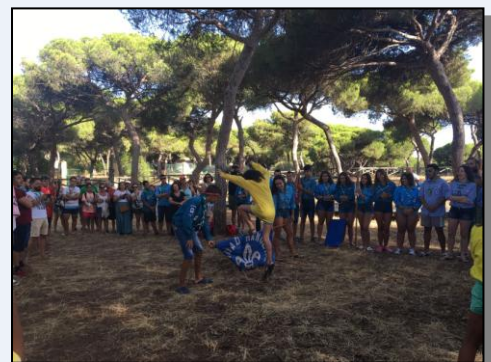
Salto de Bandera en el Pinar (31 de julio).