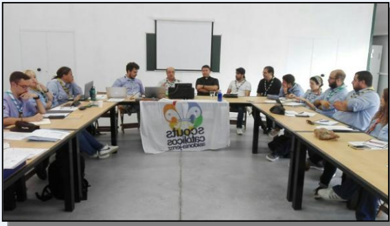
Consejo Diocesano (15 de septiembre).