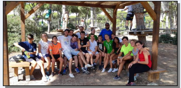
Las Patrullas Bull-Dog, Halcón y Cobra visitando Entre Ramas Aventura, en Roche.